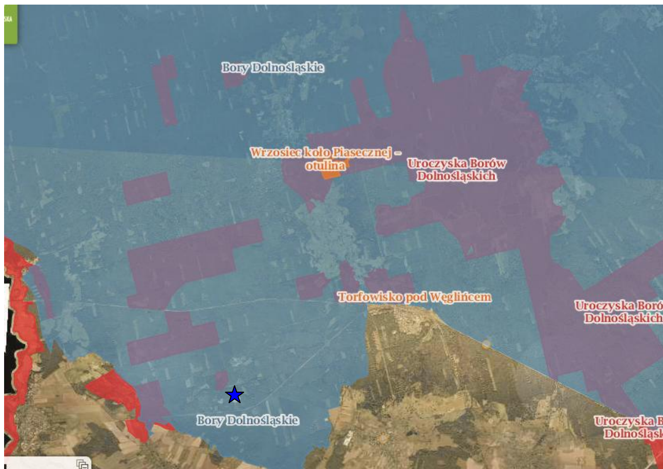
Ryc. 2. Położenie obszaru opracowania na tle obszarów sieci NATURA 2000.

W północno-zachodniej części obszaru objętego planem miejscowym znajduje się fragment Specjalnego Obszaru Ochrony Siedlisk NATURA 2000 – Dyrektywa Siedliskowa „Uroczyska Borów Dolnośląskich” – kod obszaru PLH080027.